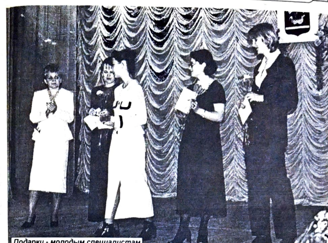
Подарки - молодым специалистам